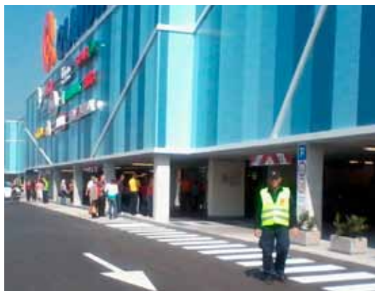
Naši varnostniki so prizadevno usmerjali in varovali obiskovalce in nakupovalce na otvoritvi Qlandije.

S tehničnimi sistemi varovanja smo opremili podjetja Inoks center, Potokar in Orbico, Medicinsko fakulteto ter dogradili sisteme v poslovalnicah Mercatorja, NLB, Unicredit banke in Pošte Slovenije. S tehničnim varovanjem objektov s prenosom signala na varnostno nadzorni center ter interveniranjem smo pričeli za Kemis Vrhniko, Vrtec Mengeš, Galerijo Aksioma, C&A modo, Rutar, Dipo, Margento storitve, Adel in Matično knjižnico Kamnik.