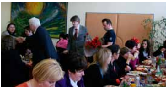
Za dan žena smo se tudi v Sintalu obdali z rožicami.

Letošnji pustni torek je bil še prav posebno pisan, saj so takrat svoj dan praznovala tudi dekleta in žene.