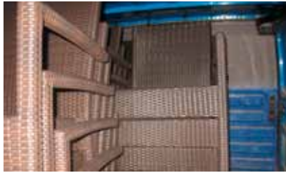
Tatova sta pridno polnila svoj kombi.

Ptuj, 7. 4. - Intervent je v večernem času po sproženem alarmu v Živexu pri sosednjem objektu prijel vlomilca, ki naj bi v dogovoru s poslovodjo kupoval ploščice. Navedbe so bile neresnične, zato je "nakupovalca" predal policiji.