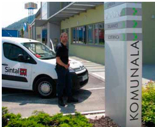
Na javnem razpisu smo bili izbrani za varovanje Javnega podjetja Komunala Slovenj Gradec.

Med novimi naročniki je tudi Croning Livarna, za katero izvajamo priklop protivlomnega in protipožarnega sistema na VNC z intervencijo. Protipožarno varovanje izvajamo še za Cablex-M, podjetje PIN in Lukov Dom na Kopah. Na javnem razpisu smo bili izbrani za protivlomno in protipožarno varovanje treh lokacij Javnega podjetja Komunala Slovenj Gradec in Carinskega urada v Dravogradu. Izredna fizična varovanja smo opravili za Javni zavod Spotur, Mestno občino Slovenj Gradec, Hofer, Lidl, Spar in Mercator. Zaposlili smo tri varnostnike.