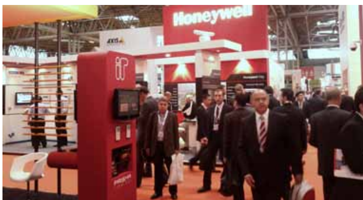
Množičen obisk na razstavnem prostoru našega dobavitelja opreme za tehnično varovanje.