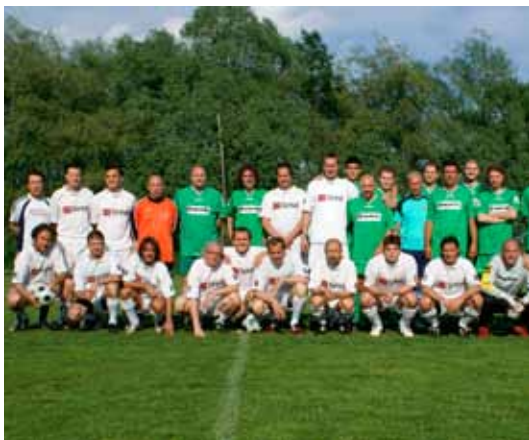
NAST v Sintalovih belih dresih na pripravljalni tekmi proti ekipi časnika Dnevnik.

Koncern Sintal je poklonil nogometne drese neuradni slovenski novinarski nogometni reprezentanci, ki že od leta 1995 deluje pod imenom Novinarski all-star team (NAST).