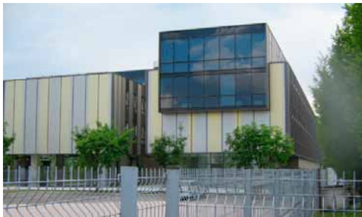
V fazi prevzema je tudi večji poslovni objekt Imparo na Viču v Ljubljani.

Razširili smo dejavnost upravljanja stavb na Primorskem, saj smo prevzeli v skrb stanovanjsko poslovni objekt Punta v Piranu. V fazi prevzema je tudi večji poslovni objekt Imparo na Viču v Ljubljani, ki je v zaključni gradbeni fazi, naša vzdrževalna ekipa pa se tekoče seznanja z gradbeno tehničnimi lastnostmi objekta, oz. se usposablja na področju vgrajenih strojnih in elektroinstalacij.