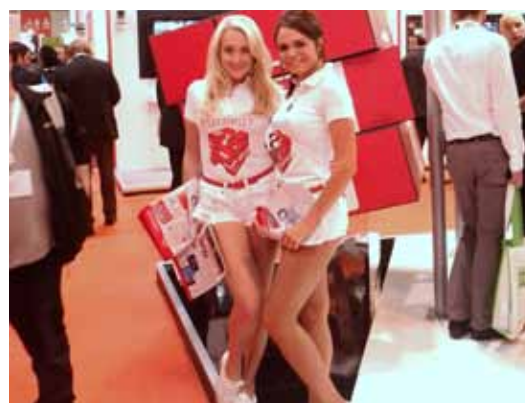
Sejemski ponudba je bila zelo pestra.