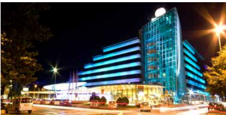
Hitov največji igralniško-zabavišni center Perla v Novi Gorici.

Na splošno je opaziti, da imajo ljudje sicer več prostega časa, a v manjših dozah. Nekajdnevne počitnice, podaljšani vikendi, a večkrat letno, postajajo prepoznaven del načina življenja pri nas in drugod po svetu. Tem spremembam se prilagajamo, obenem pa se temeljito pripravljamo, da svoje bogato znanje in izkušnje ponudimo tudi zunaj meja domovine. Prvič v zgodovini družbe Hit se resno dogovarjamo za prenos znanja na zelo oddaljene trge.