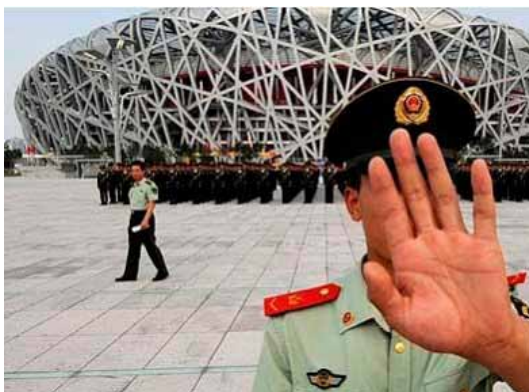
Varovanje prihodnjih olimpijskih iger bo za Veliko Britanijo predstavljalo velik izziv.