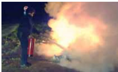
Interventka se je uspešno lotila ognja.

Ljubljana, 1. 5. - V Srednji trgovski šoli je v smetnjakih prišlo do požara. Prihitali so interventi, ki so se lotili gašenja ter gasilcem zagotovili nemoten dostop. Slednji so požar pogasili, preden so se ognjeni zublji razširili v notranjost objekta.