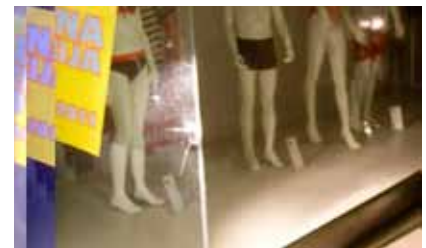
Opitega sprehajalca je zmotila reklamna tabla.

Koper, 30. 5. - V večernem času se je sprehajalec, ki je kazal očitne znake opitosti, lotil reklamne table pred trgovino Mana in poškodoval izložbeno steklo. Ujel ga je intervent, ki se je odzval na alarm loma stekla, in ga predal policistom.