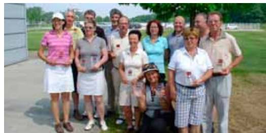
Zmagovalci so se za pokale pošteno potrudili.