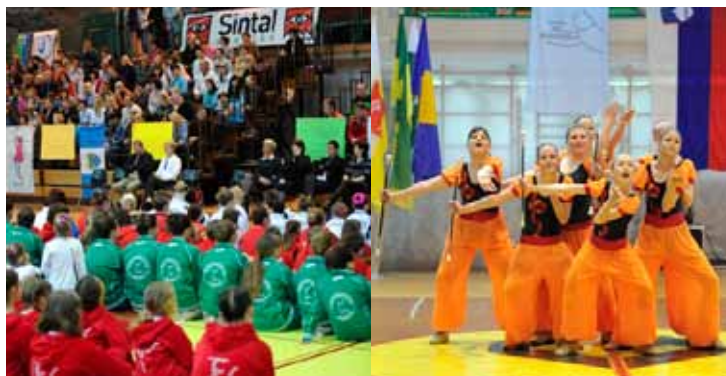
15. državno prvenstvo v twirlingu je bilo zelo pisano.