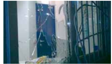
Vlomilca sta si pot utirala z macolo.

Velenje, 2. 5. - Sintalovi interventi so se odzvali na vlomni alarm v Lidlu. Po filmskem pregonu so ujeli enega od dvojice na podvig dobro pripravljenih, zamaskiranih vlomilcev, ki sta z macolo razbila vrata pisarne in trezorja, kjer sta iskala denar. A vse zaman, oba sta že v rokah policistov.