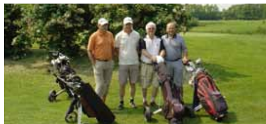
Turnir sta spremljala lepo vreme in prijetno vzdušje.

Doseženih je bilo nekaj lepih rezultatov. Zmagovalcem v različnih kategorijah, med drugim tudi za najdaljše udarce in najbližji udarec k zastavici, smo podelili pokale. Po končani igri smo posejeli ob okusni hrani in dobri pijači, igralci, ki so bili z izvedbo turnirja in igro zelo zadovoljni, pa so izrazili željo in obljubo, da se naslednje leto ponovno snidemo.