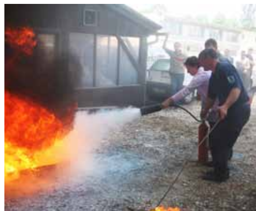
V Sintalu izvajamo tudi usposabljanja odgovornih oseb za gašenje začetnih požarov.