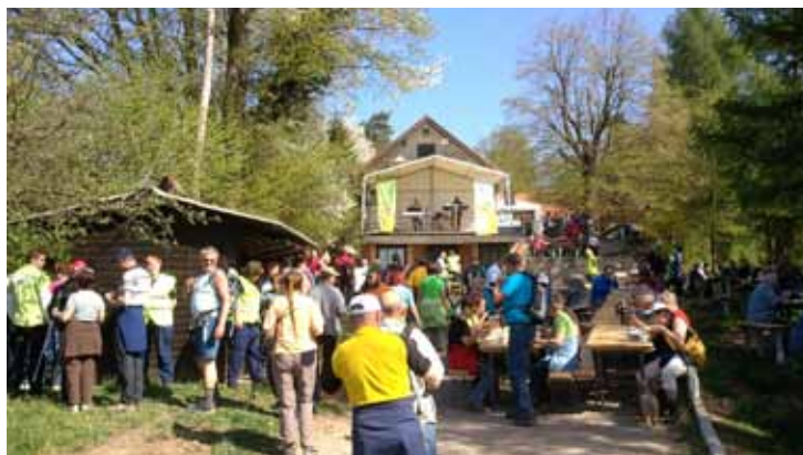
Za varnost smo poskrbeli tudi na pohodu na Sveto Jedrt.

Na Spodnjem Štajerskem je bil pomladanski čas v znamenju varovanja sejmov Flora, Poroka, Altermed, Čebelarji 2011, Forma tool, Plagkem, Graf & Pack in Livarstvo. Varovali smo tudi Športni vikend v Laškem, otvoritev Inposa v Prevaljah, razne koncerte, kresovanja, vse košarkarske tekme KK Zlatoroga Laško in ženskega košarkarskega kluba Celje ter tekme RK Celje Pivovarna Laško. Pričeli smo s fizičnim in tehničnim varovanjem v Pivovarni Laško, sisteme tehničnega varovanja pa vgradili v Qlandii Kamnik, Inposu Prevalje, Sparu Zreče, Eurospinu Prevalje, PUP Velenje.