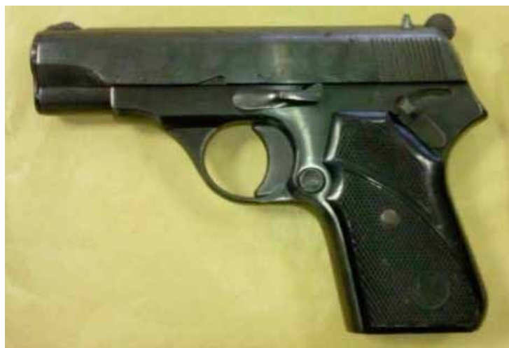
Najpogostejša oborožitev varnostnikov, pištola CZ-M70, je zaradi netočnosti, majhne kapacitete nabojnika in slabše lege v roki vse manj priljubljena.

odgovorna oseba za orožje, Sintal Fiva d.o.o.