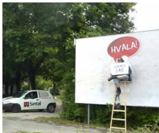
V odmevni vseslovenski akciji za promocijo krvodajalstva sodelujemo že od prvega dne.