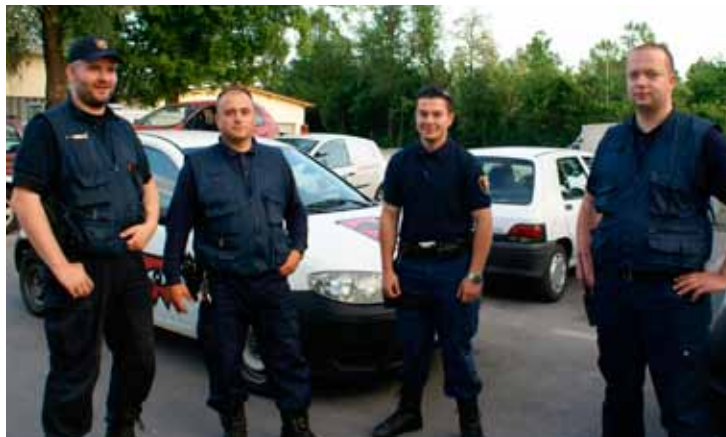
Pogovor in izmenjava izkušenj med Sintalovimi interventi.