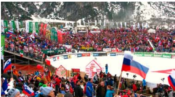
V Planici sta vladala veselo vzdušje in navijanje.

Varovanje sta nam zaupala še dva strateška partnerja, Gorenjska Banka in Petrol. V svoje vrste smo sprejeli 15 novih sodelavcev. S tehničnimi sistemi smo opremili Tržiški muzej, Harsco Minerale, palačinkarno na Jesenicah, zlatarstvu Pustovrh in Klemenčič, Hartman & Hartman Lesce in OMV v Radovljici. Za strelski center Belit je razvojni oddelek Sintala razvil sistem za sledenje tarč z lasersko tehnologijo. Varovali smo 50. svetovni pokal Vitranc, X-plozijo zabave, smučarske skoke v Planici, Pokal Spar, tekme RK Merkur Škofja Loka, mednarodno prvenstvo v badmintonu, XDrive in postavitev temeljnega kamna Baumaxa v Šenčurju. Izobraževali smo se za javna zbiranja in intervencijske skupine.