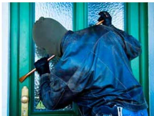
Pred odhodom z doma je potrebno poskrbeti vsaj za osnovne varnostne ukrepe.

Anketiranci so bili še vprašani, komu bi zaupali ključ stanovanja ali hiše, pri čemer ocena 1 pomeni, da mu sploh ne bi zaupali, ocena 5 pa, da bi mu popolnoma zaupali. Slovenci bi ključ svojega stanovanja ali hiše najbolj zaupali policiji (povprečna ocena 4,1), sorodniku (povprečna ocena 3,8) ali pooblaščenemu podjetju za varovanje (povprečna ocena 3,7), najmanj pa sosedu (povprečna ocena 3,4), zancu ali prijatelju (povprečna ocena 3,0) in sodelavcu v službi (povprečna ocena 2,8).