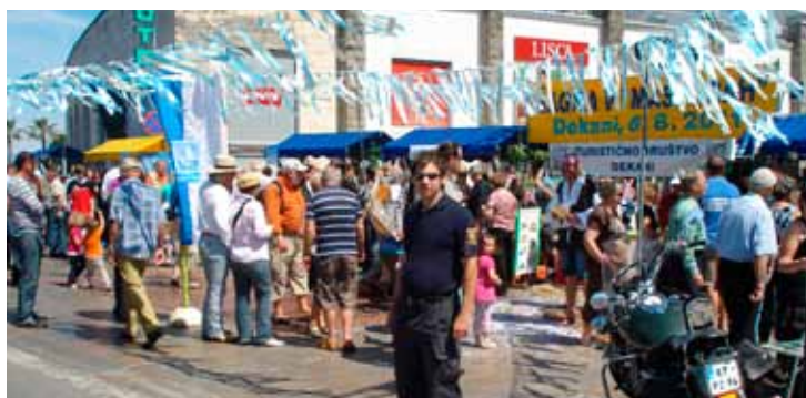
Na Predstavitvi krajevnih skupnosti občine Koper je bilo živahno in zabavno.

Varovali smo dogajanje v Agrariji Koper, Soseski Nokturno in poskrbeli, da so prireditve Planet nori do polnoči, Razstava eksotičnih živali, Koncert Hip – hop MKC Koper, Koper praznuje z otroci, in nogometna tekma FC Koper - NK Partizan Beograd potekale brez izgredov.