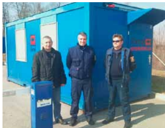
V Prekmurju in Prlekiji imamo nov intervencijski bivalnik.

Za varnost obiskovalcev smo poskrbeli na koncertu Riblje čorbe, prireditvi Delu čast in oblast, Kasaški dirki, Sejmu Megra in Sejmu lovstva in ribištva, Festivalu nakupov in zabave BTC ter na treh manjših prireditvah za podjetnike. Izvajamo nova obhodna varovanja na objektih Tondach SLO, Šavel center, Trgovski center Lendava in Komptech. Pridobili smo tudi dva nova naročnika storitve prevoza gotovine. Večje montaže sistemov tehničnega varovanja smo izvedli v Vrtcu Černelavci, Kmetiji Cigut, Hladilstvu, Grajski pristavi v Ormožu, Avtotestu, Bioplinarni Panvita in Petrolu SND Lendava. Na VNC smo priklopili 29 objektov in podpisali devet pogodb za vzdrževanje protipožarnih sistemov.