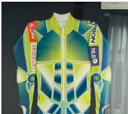
Tekmovalni dres Tine Maze, s katerim je osvojila tretje mesto v skupnem seštevku svetovnega pokala.

Eno od načel Sintala je po najboljših močeh pomagati tistim, ki potrebujejo pomoč. Tako smo med drugim na dobrodelni dražbi kupili zmagovalni dres Tine Maze.