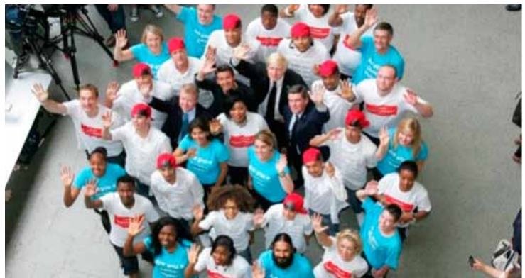
Za varnost na olimpijskih igrah bodo med drugim skrbeli tudi prostovoljci.