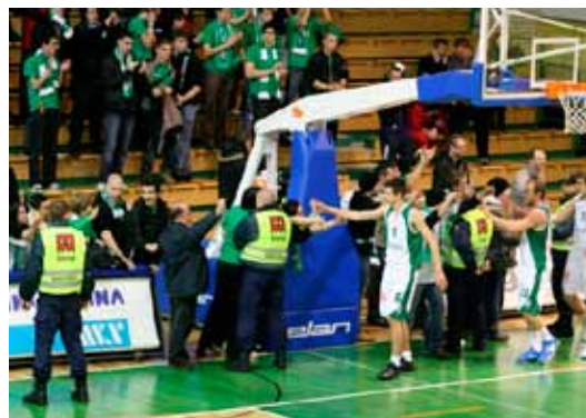
Košarkarski klub Krka je letos nanizal kup uspehov.