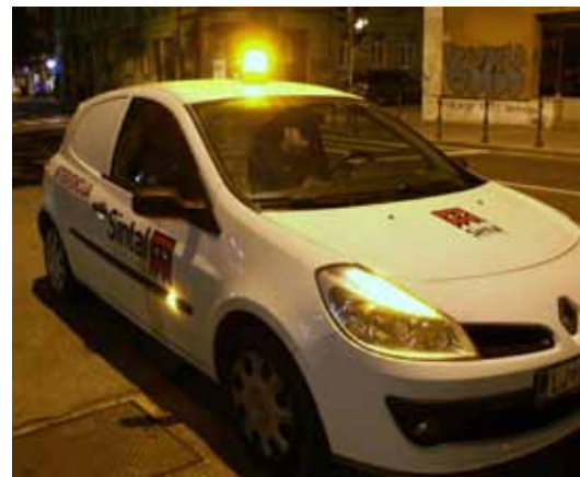
Sintalov avto na ljubljanskih ulicah.