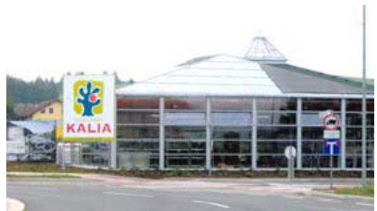
Za Semenarno Kalia odvažamo gotovino