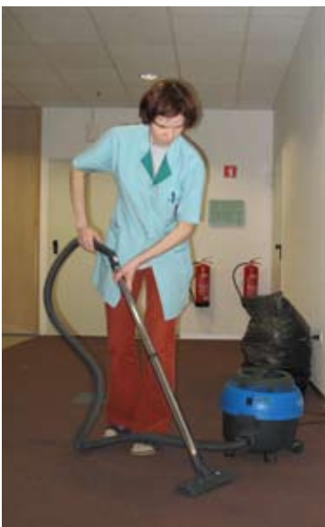
Z novimi pripomočki je delo lažje