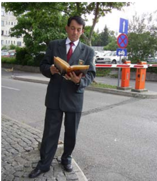
Potrebno se je zavedati pomembnosti poznavanja kodeksa

Upošteva pravila, vsebovana v Splošni deklaraciji OZN o človekovih pravicah, Mednarodnem paktu o državljanskih in političnih pravicah, Deklaraciji o zaščiti vseh oseb pred mučenjem in drugimi oblikami okrutnega, nečloveškega ali ponižujočega ravnanja in kaznovanja.