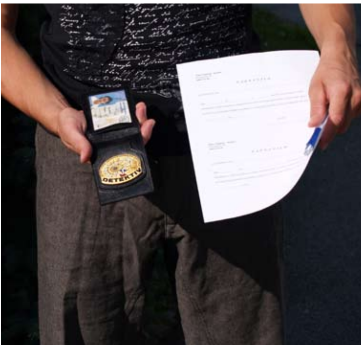
Od želje naročnika je odvisno, ali detektiv sploh stopi v kontakt z delavcem.

Na Združenju delodajalcev Slovenije ocenjujejo, da se delež zlorabe bolniške odsotnosti približuje 20 odstotkom.