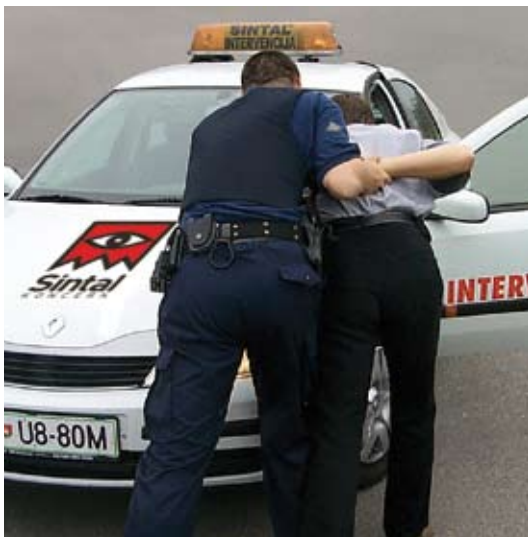
Varnostnikovi ukrepi morajo biti skrbno preiščljeni in čim manj grobi posegi v posameznikove pravice

Določnost ( lex certa ) je bistvena prvina načela pravne države (2. člen ustave), ki je posebej poudarjena pri posegih v pravice posameznika. Vsebinski pogoji in procesi odločanja