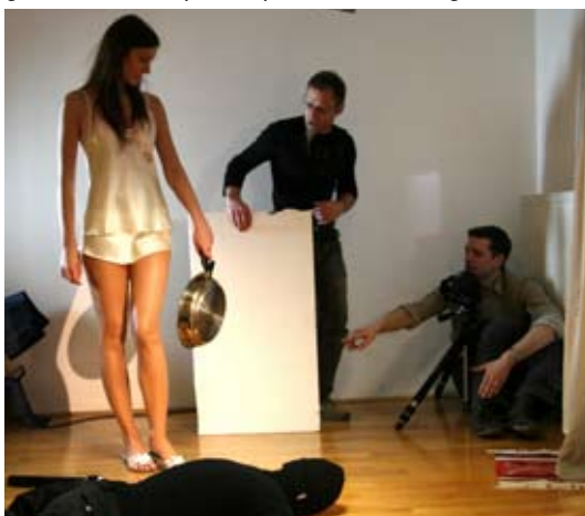
Za najboljši učinek je bilo vložnega veliko truda