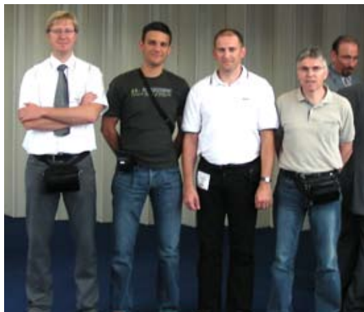
Ekipa, ki je za Sintal preverjala novosti na sejmju

Prepoznavanje s pomočjo biometrije srečujemo na vsakem koraku. Video tu dobiva ključno vlogo. Demonstrirana je bila vrsta aplikacij (prepoznavna obraza, telesa, načina hoje), skupni imenovalac vseh je bil visok odstotek prepoznave.