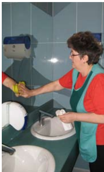
Danica nam je razkazala spretnosti čiščenja sanitarij ...