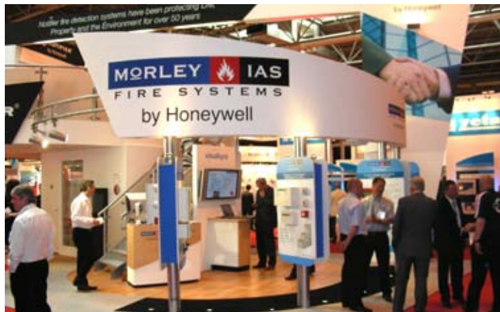
Podjetje Morley IAS je naš partner na področju protipožarnih sistemov