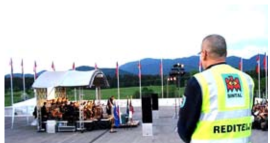
Varovanje proslave v Kočevski reki ob obletnici ustanovitve manevrske strukture narodne zaščite