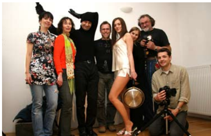
Utrujena, a zadovoljna ekipa po opravljenem delu

Enodneвно snemanje oglasa se je začelo zjutraj ob 10. uri, ko je ekipa, sestavljena iz lučkarjev, producentke in scenografa prišla na lokacijo snemanja. Snemanje se je začelo ob 15. uri, ko so se jim pridružili glavni igralec in stranska igralka, ki sta pred tem bila v maski, glavni snemalec s tajnico in avtorica oglasa. Da je bil rezultat popoln, je bilo treba scene nekajkrat ponoviti, tako da se je snemanje na koncu zavleklo pozno v noč.