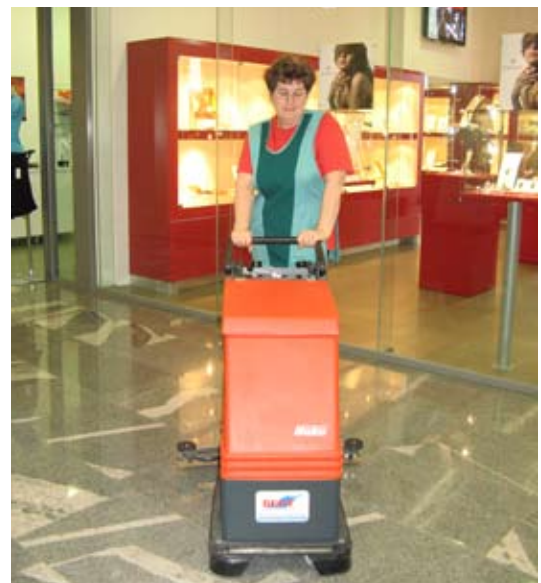
... in velikih marmornih površin v poslovnem centru Diamant