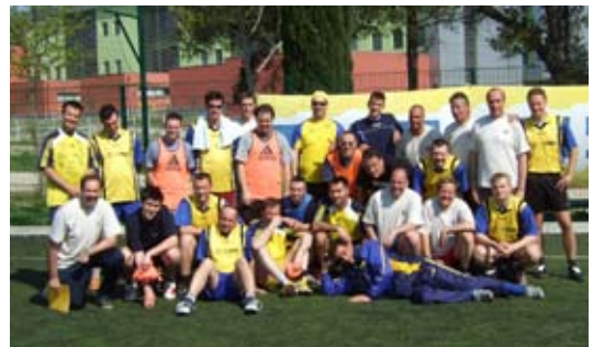
Predstavniki Sintala Istre so sodelovali na prijateljskem turnirju v nogometu med policisti, varnostniki in navijači

Za potrebe upravljanja stavb smo uvedli 24-urni klicni center. Postali smo pooblaščen upravnik poslovne stavbe na Brnčičevi 41, katere investitor je podjetje Smart inženiring, in novega stanovanjskega kompleksa na Kašeljski. S čiščenjem smo med drugim pričeli na Smart Comu, GKTI-ju in DSC-ju. Opravili smo precej generalnih čiščenj, saj je predpoletni čas idealen za to. Poskrbeli smo tudi za prijetnost bivanja v počitniških bivališčih. Z novim strojem za čiščenje večjih površin smo že uspešno očistili večjo garažno hišo.