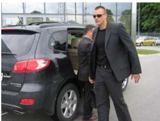
Na Gorenjskem smo razširili obseg delovanja z novo storitvijo, fizičnim varovanjem osebe s telesnim stražarjem

Tudi preteklo trimesečje je bilo za koncern Sintal živahno. Med drugim smo pridobili nove naročnike in širili obseg storitev za obstoječe naročnike, zaradi česar smo zaposlili 115 novih sodelavcev in za delo varnostnika usposobili 97 zaposlenih.