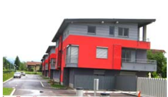
V upravljanje smo prevzeli stanovanjski kompleks Vile Kašeljska