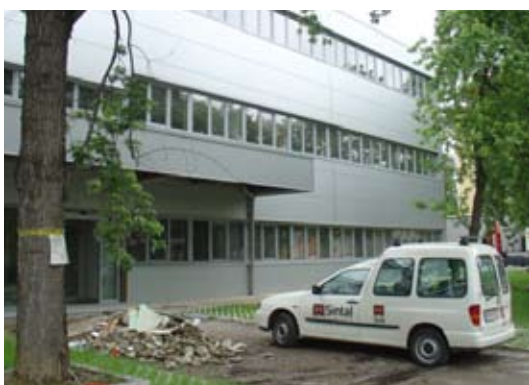
V poslovni objekt BTS Company v poslovno-proizvodni coni Tezno vgrajujemo protipožarni in protivlomni sistem