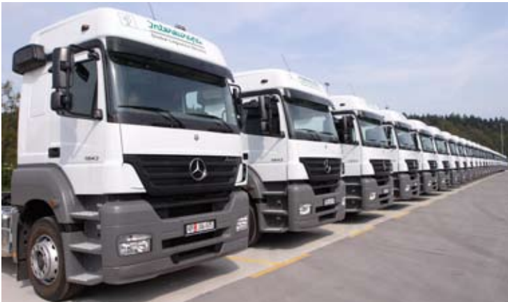
Intereuropa razpolaga s preko 450 lastnimi dostavnimi vozili

Varnost je na področju logistike bistvenega pomena. Premeščanja blaga in zagotavljanja kakovostnih logističnih storitev (prevoz, skladiščenje, manipulacije, dostave..) si brez varnosti nikakor ne moremo predstavljati. Zato sta ključnega pomena zagotavljanje usposobljenosti vseh naših zaposlenih, ki skrbijo za maksimalno varnost tako delovnih procesov kot tudi celotne dejavnosti in ne nazadnje za svojo lastno varnost. Na drugi strani pa potrebujemo tudi varne prostore, kar pomeni ne le fizično varnost objekta, temveč