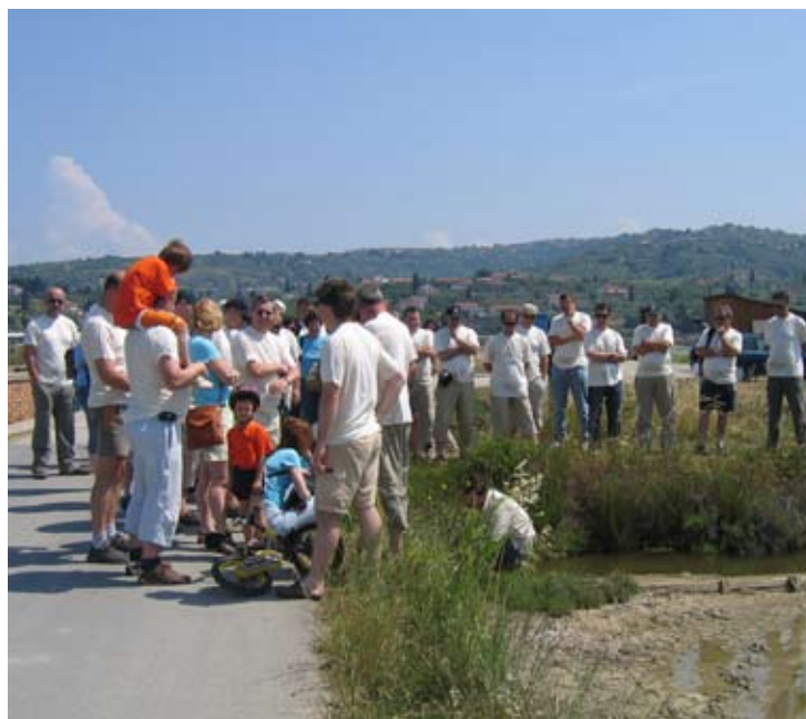
V prijetnem vzdušju smo si ogledali sečoveljske soline

Po načelu "blizu oči, blizu srca" prirejamo periodična letna srečanja zaposlenih, ki organizacijsko vodijo dela na posameznih področjih. Na teh srečanjih vzpostavljamo nove stike, izmenjujemo izkušnje, dobri medsebojni odnosi pa praviloma preidejo v osebne prijateljske vezi. S tem je cilj naših srečanj v celoti izpolnjen. Letošnje pomladansko srečanje smo imeli na Obali. Organiziral ga je kolektiv Sintala Istra. V prijetnem vzdušju smo si ogledali sečoveljske soline, nato pa smo se z ladjico popeljali po slovenski obali.