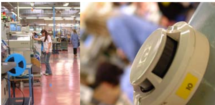
Na videz enaki javljalniki delujejo po različnih protokolih

Predstavili so nam nov javljalnik požara COPTIR, ki bo prinesel revolucijo v protipožarnih sistemih. To je kombinirani javljalnik, ki združuje štiri klasične javljalnike: detektor ogljikovega monoksida (CO), dima (P), temperature (T) in infrardeči (IR) senzor. Vsi ti štirje elementi v javljalniku bodo onemogočali lažne alarme,