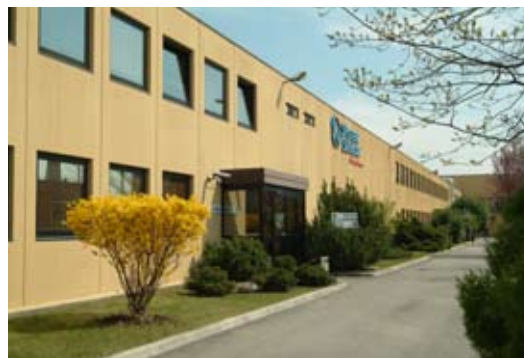
Ogledali smo si nam najbližjo tovarno System Sensorja v Trstu