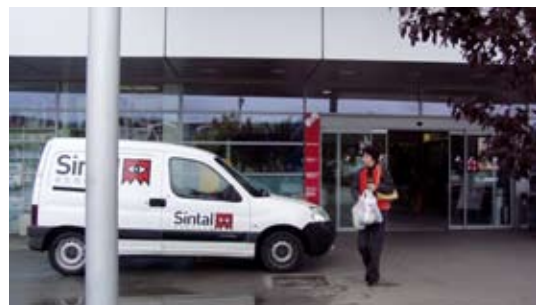
Med naročniki priklopa na VNC in intervencije je tudi novi Mercator center Slovenj Gradec